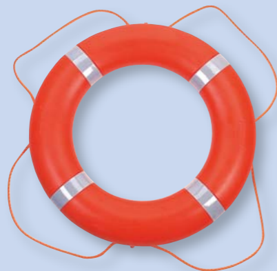
Bouée 750 mm