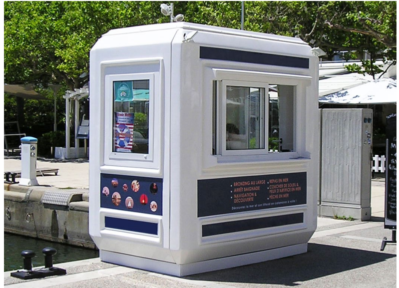
2. Kiosque Genesis™