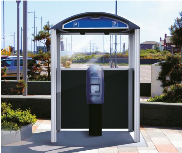
1. Abri Modus™

Glasdon est spécialisé dans la fabrication et le design d'une large gamme de kiosques amovibles type GRP ainsi que dans celle de nombreux abris. Dans notre gamme de structures les plus populaires, vous retrouverez les barrières de sécurité, les cabines de péage, les guérites de gardien pour les parkings ou encore les abris pour fumeurs.