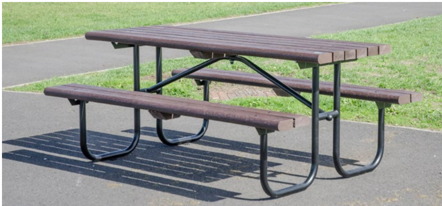
1. NOUVEAU Table pique-nique Bowland™

Notre gamme de sièges traditionnels et contemporains ne demande que peu d'entretien, résiste aux intempéries, au vandalisme et s'adapte aussi bien à une utilisation intérieure qu'extérieure.