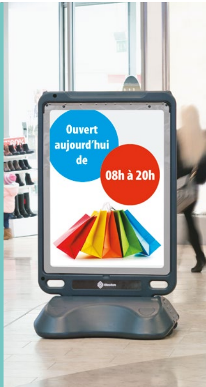
Panneau d’affichage Advocate™

Le panneau d’affichage Advocate™ offre une solution innovante pour promouvoir vos produits ou services. Advocate est également disponible en version fixation murale pour un maximum de sécurité.