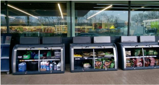
1. Armoire de stockage Orion™

Robuste et résistante, l'armoire de stockage Orion™ a été spécialement conçue pour booster les ventes et les résultats de la Grande Distribution. Orion offre une large surface de stockage avec un accès facile aux produits, encourageant ainsi les clients à acheter.