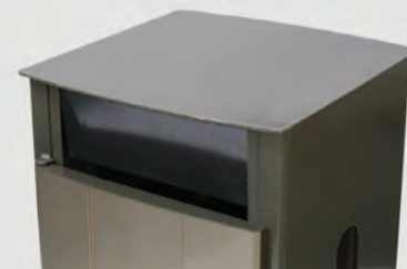
Clapets de fermeture