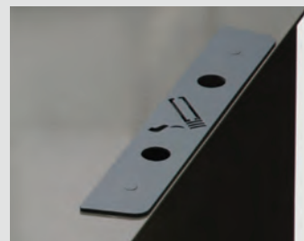
Capacité cendrier : 0,1 litres