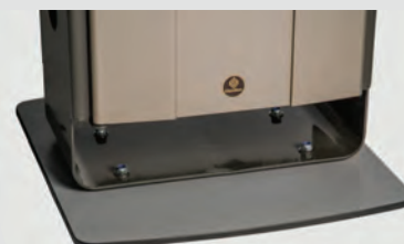
Base auto-portante (pour le modèle 60 litres uniquement)