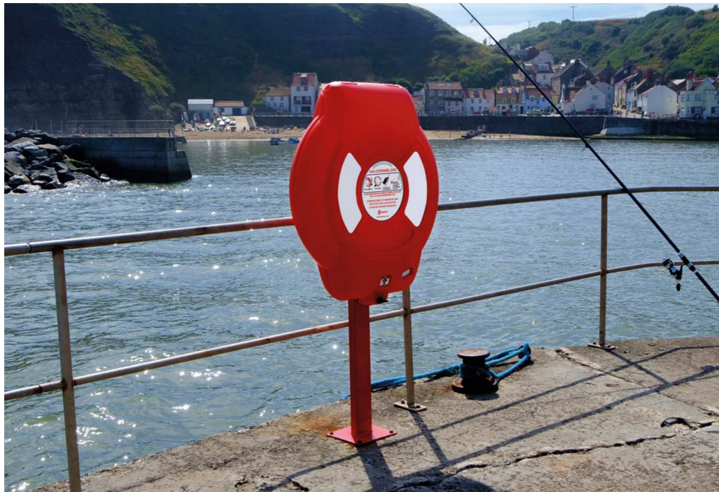
1. Guardian 750 gemonteerd aan een paal

Elke Guardian™ reddingsboeikast is ontworpen om goed zichtbaar te zijn terwijl uw belangrijke reddingsmateriaal wordt beschermd. Onze reddingsboeikasten zijn ideaal voor elk gebied waar water een gevaar kan vormen, zoals havens, stranden, meren, zwembaden en waterzuiveringsinstallaties.